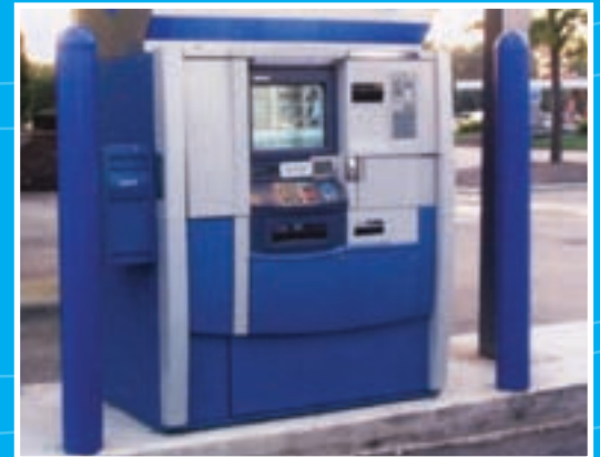
Sécurité et propreté