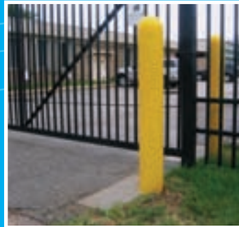
Différents diamètres offerts (de 3 à 10 pouces) Hauteur standard de 52 pouces