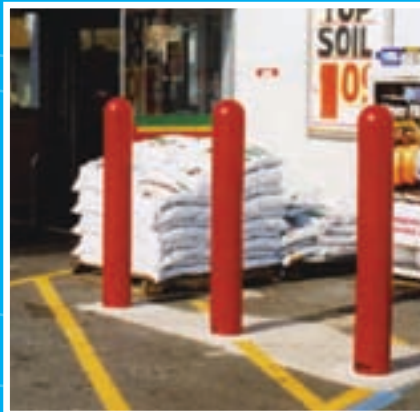
Résistant aux intempéries, traitées anti-UV et antistatique