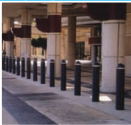
Variété de couleurs offertes