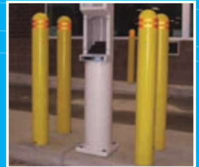
Possibilité d'ajouter des bandes réfléchissantes